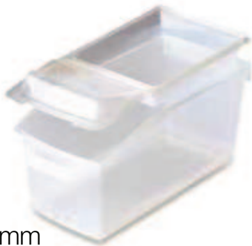
480 x 230 mm