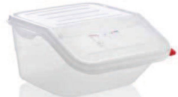
GN 2/3 - 415 x 340 mm