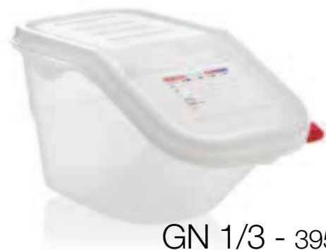
GN 1/3 - 395 x 200 mm